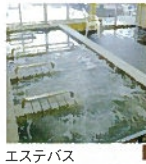
エステバス 電気風呂、座り湯