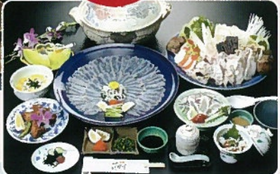
※松浦とらふこコースは3,000円追加となります。