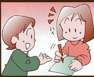
② 貸渡契約書にご記入下さい。 ※料金は前払いです。