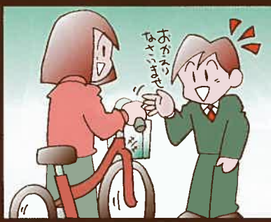
⑤ 目的地を時間内に観光したら返却いただけます。