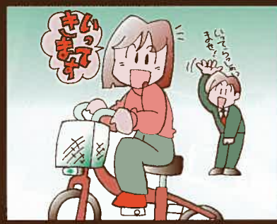
③ レンタサイクルで 観光地へGO!!