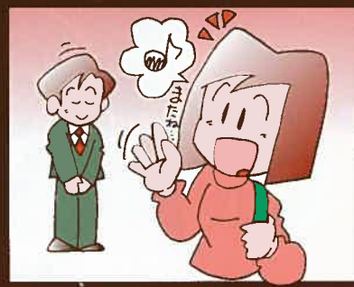
⑥ 楽しい思い出と共に次の目的地へ…。またのお越しをお待ちしております。