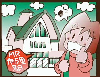
① MR伊万里駅に着きます。