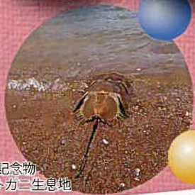
天然記念物 カブトガニ生息地